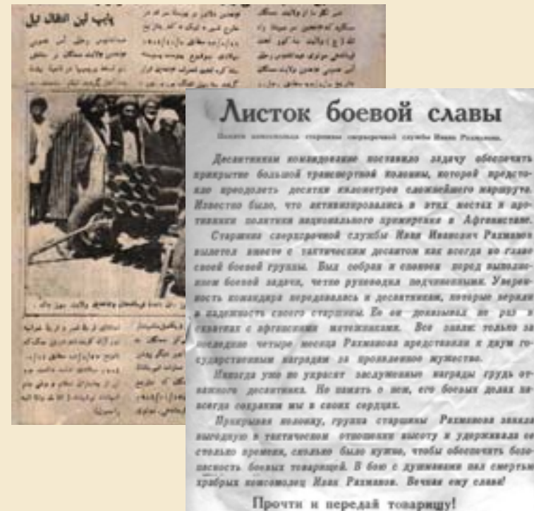
Листовки афганская и советская, 1980-е годы