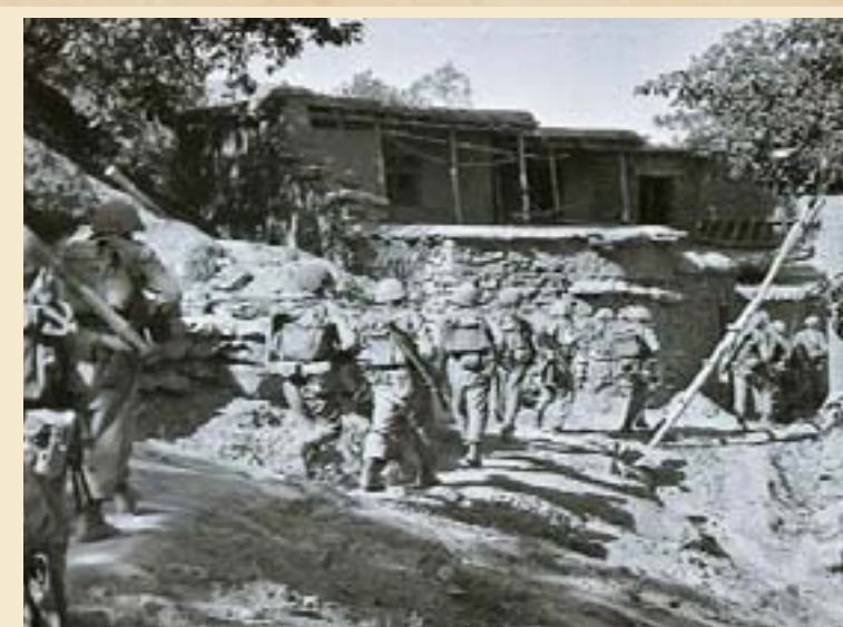
Зачистка кишлака в ходе операции «Возмездие». Афганистан, 22 октября 1987 года

ющая историю развития десантно-штурмовых маневренных групп и их действий во время войны в Республике Афганистан». Так получилось, что приведение в «понятную систему» и стало наиболее сложным для нас обстоятельством. Учитывая, что неоднократно сменялся личный состав десантных